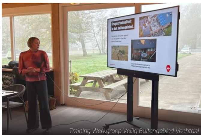
Training Werkgroep Veilig Buitengebied Vechtdal